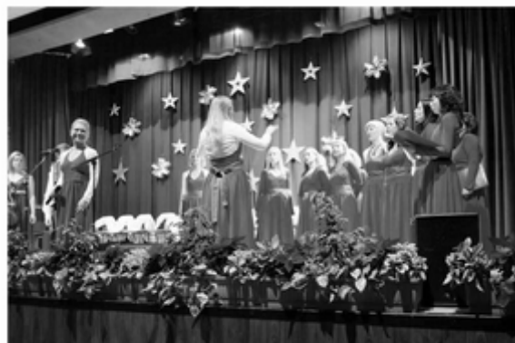
8. Dezember → Weihnachtsgala der Robert-Stolz-Gesellschaft in Wien Floridsdorf

Man sieht sich im Gramsel-Keller oder im Gramsel- Hof bei Rauchwölkchen und Glühwein!